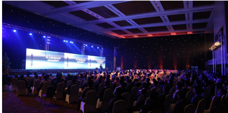
Salah satu daripada program ESQ yang dianjurkan. 4

adalah hasil kajian seorang Hindu VS Ramachandran. Kedua-dua penemuan ini disahkan dengan ayat al-Quran (Al-Hajj, ayat 46). 3